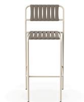
Tabouret Gelato Nacar + Lattes Trufa