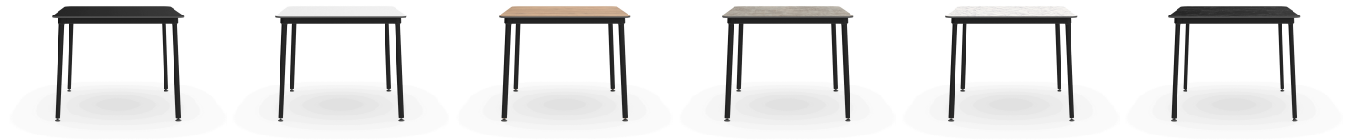
Table Hub Noire 90x90 Hpl Noir 06335