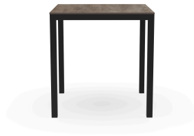
Table Barcino 70x70 Compact Chêne Cendré/Noire 04022