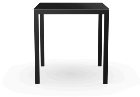
Table Barcino 70x70 Compact Noire/Noir 03031