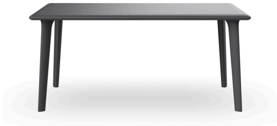
Table New Dessa 160x90 Gris Foncé 03946