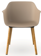
Fauteuil Shape Wood Arena 05311