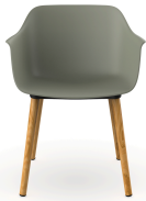
Fauteuil Shape Wood Gris- Vert 05310