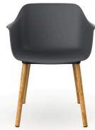
Fauteuil Shape Wood Gris Foncé 05312