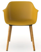
Fauteuil Shape Wood Toscan 05314