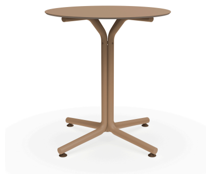
Table Bini Sable Hpl Sable Ø70 06638