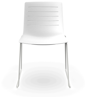
Chaise Luge Skin Blanche 03458