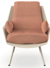
Fauteuil Anou Nacar Amber 07063