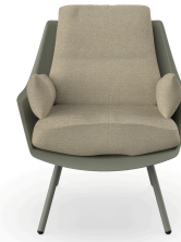
Fauteuil Anou Salvia Limonetto 07064