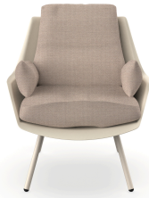
Fauteuil Anou Nacar Mud 07062