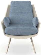
Fauteuil Anou Nacar Denim 07061