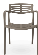
Chaise Toledo Aire Trufa 06833