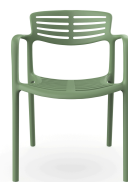
Chaise Toledo Aire Olivo 06839