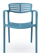
Chaise Toledo Aire Marina 06835