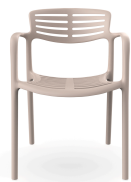
Chaise Toledo Aire Boletus 06841