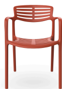
Chaise Toledo Aire Greda 06838