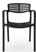
Fauteuil Toledo Aire Noche 06831