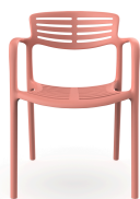
Chaise Toledo Aire Rosal 06837