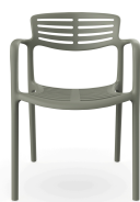
Chaise Toledo Aire Salvia 06832