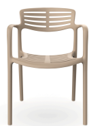
Chaise Toledo Aire Duna 06829