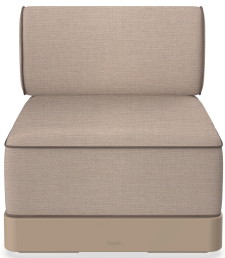
Brisa Basic Duna Coussin Mud + Mocha 06793