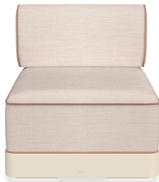
Brisa Basic Nácar Coussin Hazelnut + Amber 06794