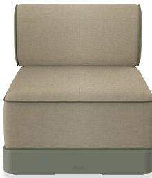
Brisa Basic Salvia Coussin Limonetto + Fern 06795