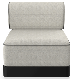
Brisa Basic Noche Coussin Salina 05 + Dolce 55 06796