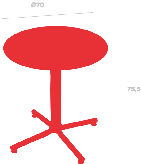
Table Bini pour usage intérieur et extérieur. Fabriqué en polypropylène avec fibre de verre, avec protection UV. Poids 7,34 kg