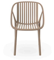
Chaise Bini Sable 05381