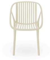
Chaise Bini Ivoire 05378