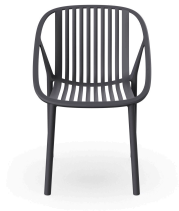
Chaise Bini Gris Foncé 05376