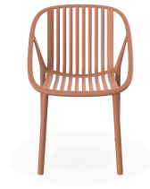
Chaise Bini Terra Cotta 05379