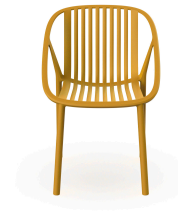
Chaise Bini Toscan 05380