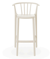
Tabouret Haut Woody Ivoire 05444