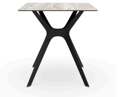
Table 70x70 Phénolique Bois Delavé Pied De Table Vela &quot;s&quot; Noir 04057