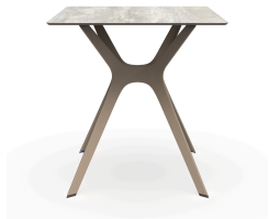
Table 70x70 Phénolique Bois Delavé Pied De Table Vela &quot;s&quot; Sable 04060