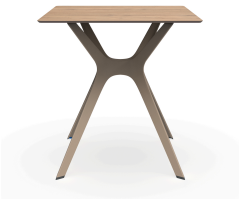
Table 70x70 Phénolique Chêne Naturel Pied De Table Vela &quot;s&quot; Sable 04062