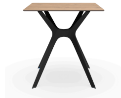
Table 70x70 Phénolique Chêne Naturel Pied De Table Vela &quot;s&quot; Noir 04059