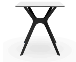
Table 70x70 Phénolique Blanche - Pied Vela &quot;s&quot; Noir 03058