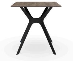
Table 70x70 Phénolique Chêne Cendré Pied De Table Vela &quot;s&quot; Noir 04058