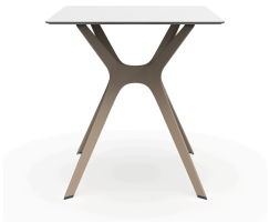
Phenolic White Table 70x70 Vela &quot;s&quot; Sand Table Foot 03061