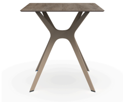
Table 70x70 Phénolique Chêne Cendré Pied De Table Vela &quot;s&quot; Sable 04061