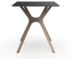
Table 70x70 Phénolique Noire Pied De Table Vela &quot;s&quot; Sable 03062