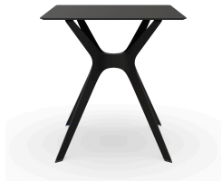
Table 70x70 Phénolique Noire Pied De Table Vela &quot;s&quot; Noir 03059