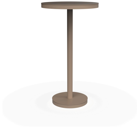
Table Barcino Ø60 Pied Central Haut Sable 01433