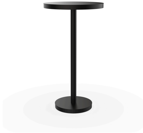
Table Barcino Ø60 Pied Central Haut Noire 01434