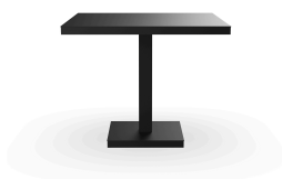
Table Barcino 90x90 Pied Central Noire