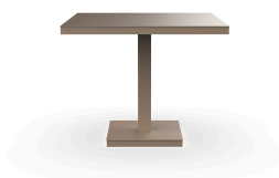
Table Barcino 90x90 Pied Central Sable