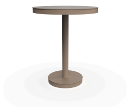
Table Barcino Ø60 Pied Central Sable