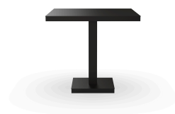
Table Barcino 80x80 Pied Central Noire