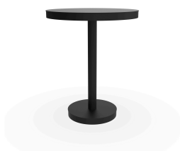
Table Barcino Ø60 Pied Central Noire