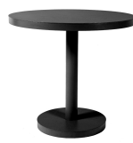
Table Barcino Ø80 Pied Central Noire