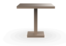
Table Barcino 80x80 Pied Central Sable