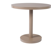
Table Barcino Ø80 Pied Central Sable