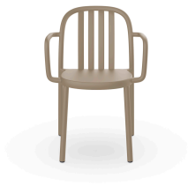
Fauteuil Sue Lamas Sable 05175