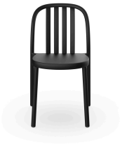
Chaise Sue Lamas Noire 05168