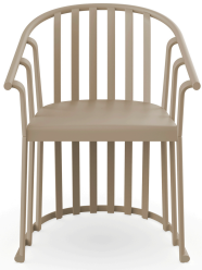
Fauteuil Raff Sable 04908