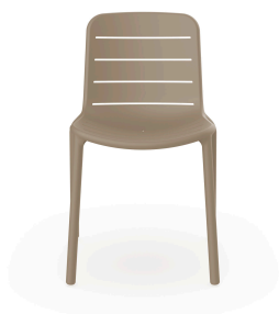
Chaise Gina Sable 03498