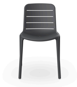
Chaise Gina gris foncé 06461