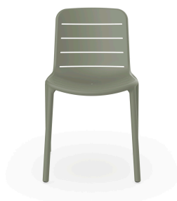
Chaise Gina gris verdâtre 06462