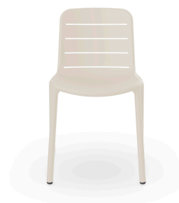
Chaise Gina Ivoire 07143