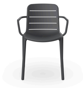
Chaise Gina Avec Accoudoirs Gris Foncé 05261