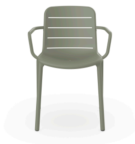
Fauteuil Gina Gris Verdâtre 06460