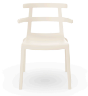
Chaise Tokyo Haute Ivoire 01617