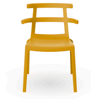
Chaise Tokyo Haute Toscan 01624