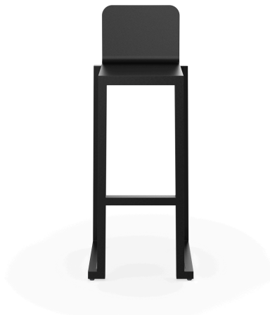
Tabouret Barcino Noir 01398