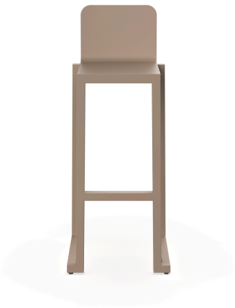
Tabouret Barcino Sable 01397