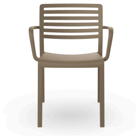
Fauteuil Lama Sable 01326