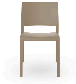
Chaise Fiona Sable 00950