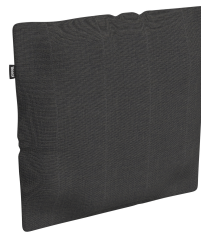
Cojín Decorativo Brisa Dolce 55 06821