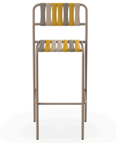
Taburete Gelato Nocciola Duna 07286