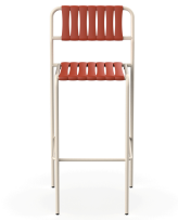
Taburete Gelato Nacar + Lamas Greda 06960