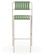
Taburete Gelato Nacar + Lamas Olivo 06957