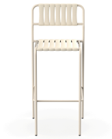
Taburete Gelato Nacar + Lamas Nacar 06978