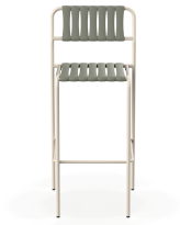
Taburete Gelato Nacar + Lamas Salvia 06956