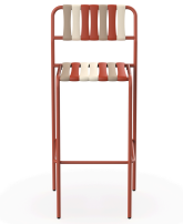
Taburete Gelato Amarena Greda 07285