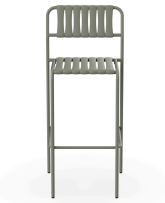
Taburete Gelato Salvia + Lamas Salvia 06979