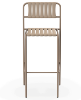
Taburete Gelato Duna Lamas Duna 07293