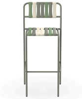
Taburete Gelato Pistacchio Salvia 07284