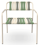
Sillon Gelato Pistacchio Nacar 06922