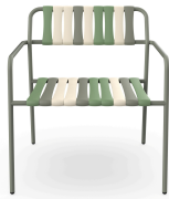
Sillon Gelato Pistacchio Salvia 07281