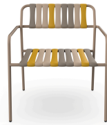
Sillon Gelato Nocciola Duna 07283