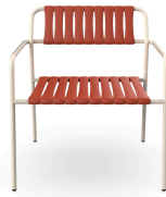
Sillon Gelato Nacar + Lamas Greda 06953