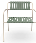
Sillon Gelato Nacar + Lamas Salvia 06949