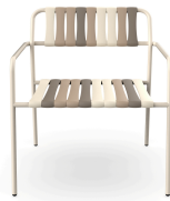
Sillon Gelato Toroncino Nacar 06924