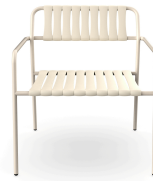
Sillon Gelato Nacar + Lamas Nacar 06975