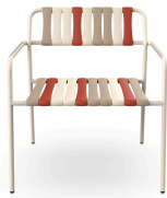
Sillon Gelato Amarena Nacar 06923