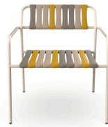
Sillon Gelato Nocciola Nacar 06925