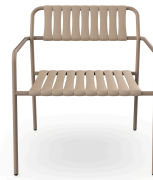
Sillon Gelato Duna Lamas Duna 07292