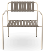
Sillon Gelato Nacar + Lamas Trufa 06952