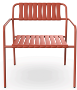
Sillon Gelato Greda + Lamas Greda 06977