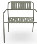
Sillon Gelato Salvia + Lamas Salvia 06976