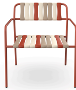
Sillon Gelato Amarena Greda 07282