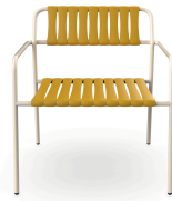
Sillon Gelato Nacar + Lamas Albero 06954