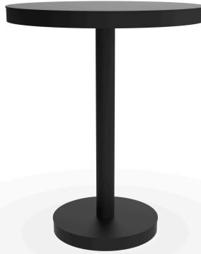
Mesa Barcino Ø60 Pie Central Negra 01432