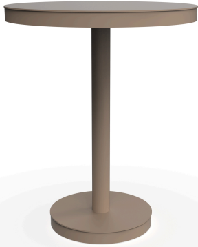
Mesa Barcino Ø60 Pie Central Arena 01431