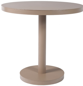
Mesa Barcino Ø80 Pie Central Arena