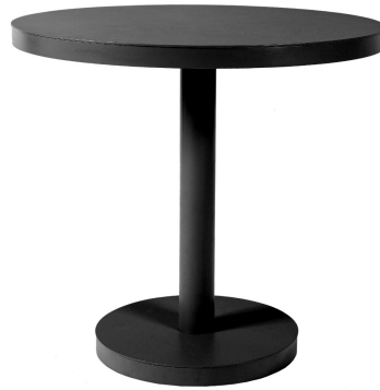
Mesa Barcino Ø80 Pie Central Negra