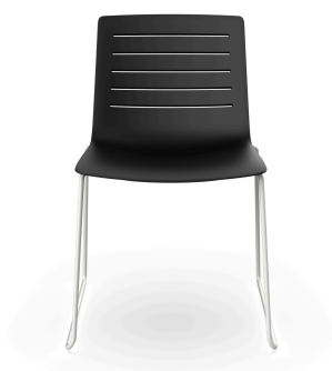
Silla Patin Skin Negra Estructura Blanca 03459