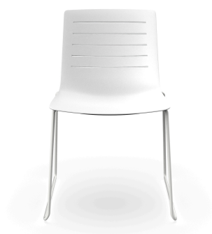
Silla Patin Skin Blanca 03458