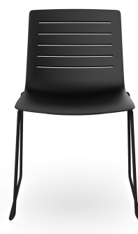
Silla Patin Skin Negra 06718