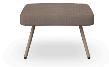
Pouf Anou Duna Mocha 07073