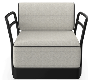
Sillon Brisa Noche Cojin Salina 05 + Dolce 55 06804