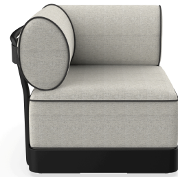
Brisa Corner Noche Cojin Salina 05 + Dolce 55 06800