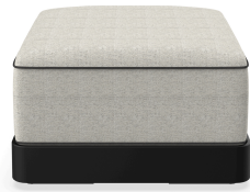
Brisa Ottoman Noche Cojin Salina 05 + Dolce 55 06792