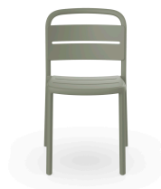
Silla Como Gris Verdoso 05345