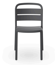
Silla Como Gris Oscuro 05344