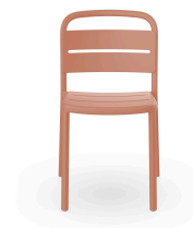
Silla Como Terra Cotta 05347