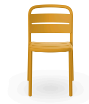
Silla Como Toscano 05348