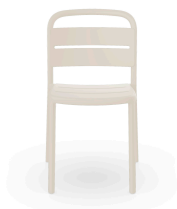
Silla Como Marfil 05343