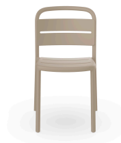
Silla Como Arena 05346