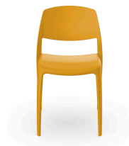
Silla Smart Toscano 05369