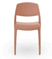
Silla Smart Terra Cotta 05368