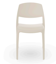
Silla Smart Marfil 07114