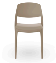
Silla Smart Arena 05366