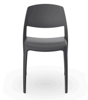
Silla Smart Gris Oscuro 05365