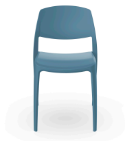
Silla Smart Azul Retro 05367