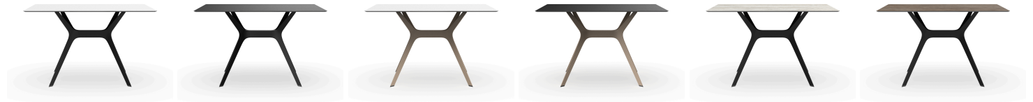
Mesa Vela M 120x80 Negra / HPL Blanco 03094