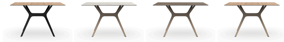
Mesa Vela M 120x80 Negro / HPL Roble Natural 04095