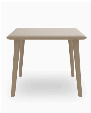
Mesa New Dessa 90x90 Arena 03945