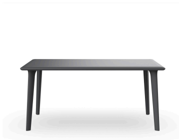
Mesa New Dessa 160x90 Gris Oscuro 03946