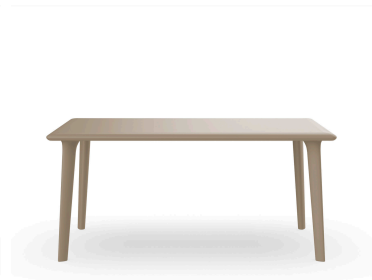
Mesa Dessa 160x90 Arena 03947