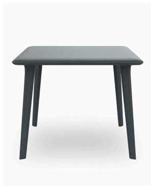
Mesa Dessa 90x90 Gris Oscuro 03944