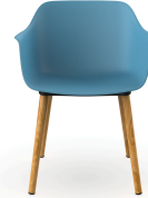
Silla Shape Wood Azul Retro 05313