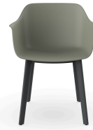
Silla Shape Gris Verdoso patas Click 05462