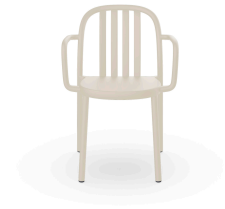
Silla Con Brazos Sue Lamas Marfil 07142