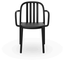
Silla Con Brazos Sue Lamas Negra 05174