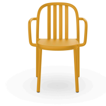
Silla Con Brazos Sue Lamas Toscano 05177