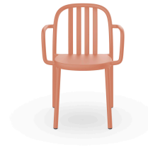
Silla Con Brazos Sue Lamas Terra Cotta 05178