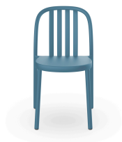
Silla Sue Lamas Azul Retro 05170