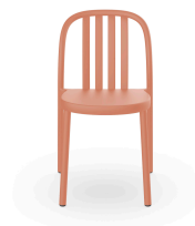
Silla Sue Lamas Terra Cotta 05172