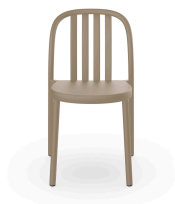
Silla Sue Lamas Arena 05169