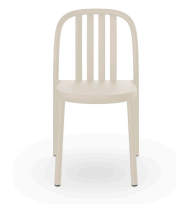
Silla Sue Lamas Marfil 07141