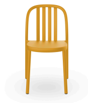
Silla Sue Lamas Toscano 05171