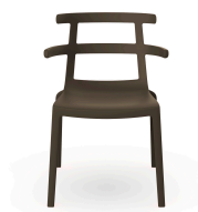
Silla Tokyo Chocolate 01621