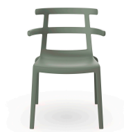
Silla Tokyo Gris Verdoso 01620