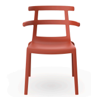
Silla Tokyo Greda 07207