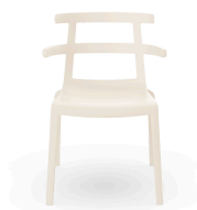
Silla Tokyo Nuevo Marfil 01617