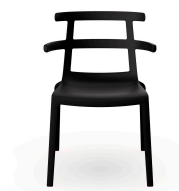
Silla Tokyo Negra 01626