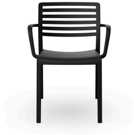
Silla Con Brazos Lama Negro 00873