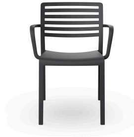
Silla Con Brazos Lama Gris Oscuro 01785