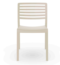
Silla Lama Marfil 07039