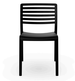
Silla Lama Negro 00866