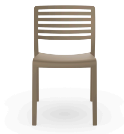
Silla Lama Arena 01336