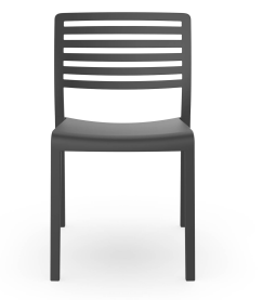
Silla Lama Gris Oscuro 01784