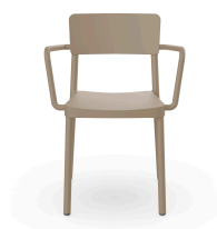
Silla Lisboa Con Brazos Arena 00953