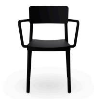
Silla Lisboa Con Brazos Negro 00820