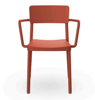
Silla Lisboa Con Brazos Greda 07058