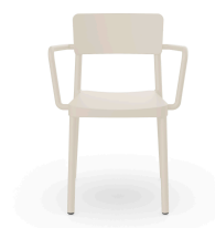
Silla Lisboa Con Brazos Marfil 07056