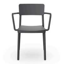
Silla Lisboa Con Brazos Gris Oscuro 00961