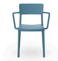
Silla Lisboa Con Brazos Azul Retro 05080