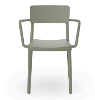
Silla Lisboa Con Brazos Gris Verdoso 07057