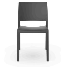
Silla Fiona Gris Oscuro 01802