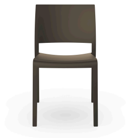
Silla Fiona Chocolate 00770